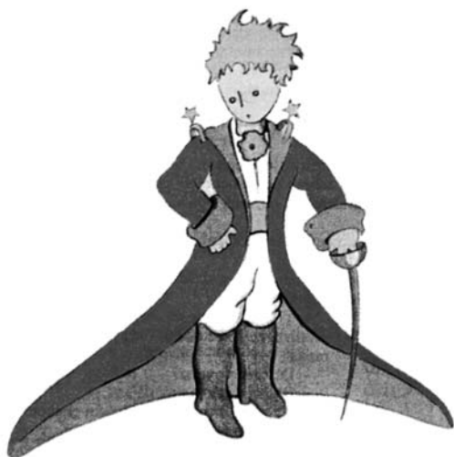
rys. A. de Saint-Exupéry

piosenki ze spektaklu „Mały Książę” Antoine de Saint-Exupéry’ego do słów Renaty Głasek-Kęski z muzyką Seweryna Krajewskiego w wykonaniu: